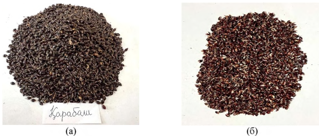
Рисунок 1. Сырьё для экстракции из сорго сорта Карабаш: (а) исходное зерно сорго; (б) шелуха, отделенная от зерна и очищенная от примесей

Шелуха изучаемого сорта (рис. 1б) была отделена от зёрен и подготовлена к экстрагированию.