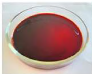
Рисунок 3. Полученный спиртовой экстракт шелухи сорго сорта «Карабаш».

допустимым отклонением \pm 15\% позволяет спрогнозировать, что потенциальный практический выход экстракта может достигать 906,9 кг на 1 тонну переработанной продукции. Полученные данные подтверждают высокий ресурсный потенциал использования вторичного сырья сорго. Для более лучшего приведения данных требуются подтверждения в ходе опытно-промышленных испытаний. По итогам проведенной экстракции из 50 г шелухи сорго сорта «Карабаш» был получен гомогенный жидкий спиртовой экстракт общей массой 0,337 \pm 0,001 кг. Полученный продукт имеет интенсивный темно-бордовый цвет, характеризуется прозрачностью, отсутствием видимого осадка или взвесей (рис. 3).